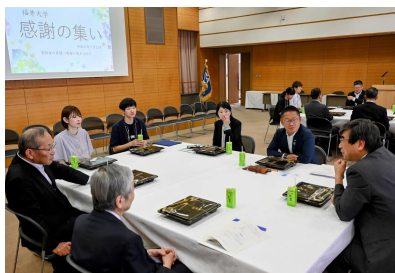
寄附者と優秀学生との食事会