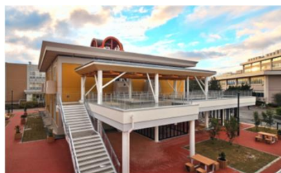
「木立ちの広場」外観

昨年12月20日のオープン記念式典では、ご寄附いただいた在学生の保護者の皆様を代表し、教育学部、国際地域学部の各後援会長様にもテープカットをお願いしました。皆様のご支援に感謝するとともに、今後は学生の新たな活動・交流拠点として活用させていただきます。