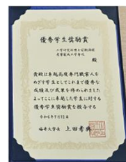
優秀学生への表彰状と奨励金