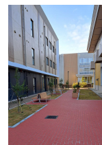
整備された交流スペース敷地内