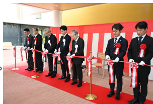
オープン記念式典テープカット