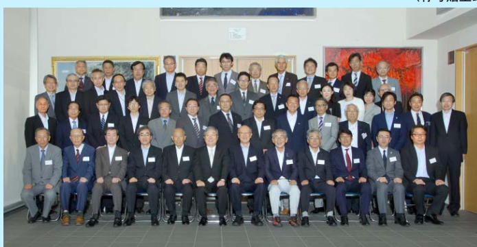
(「榮譽学友称号贈呈式」並びに「感謝の集い」の出席者の皆様)